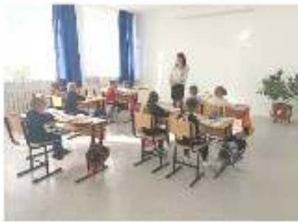
С учащимися 1 класса «Что такое буллинг?»