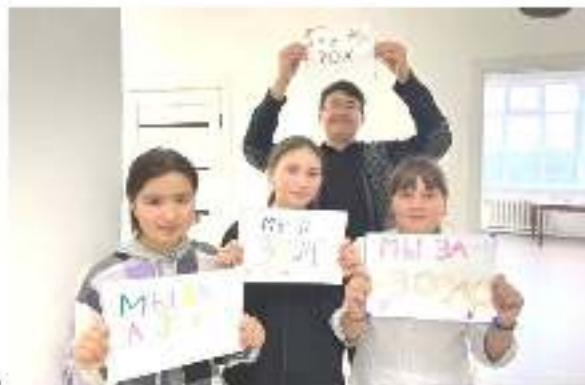
• Акция «Мы за МЫСЛЬ»

• Обсуждение школьного самоуправления: на каком этапе было изучено тематическое задание на тему «Мир глазами ребенка» и приняты решения по дальнейшему развитию.